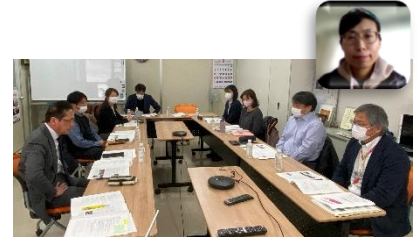
参加者のみなさん

はじめに、2023年度の活動について振り返り、出席者からは次のような意見が出されました。・各生協助成金の取り組みについて運営側の意見を聞くことがなかったのが参考になった。・防災とジェンダーの学習会は生協内での参加者からの評判が大変良かった。・各生協の地域貢献活動を知り、話げできたことがよかった。