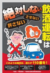
なのはな生協 組員配布チラシ