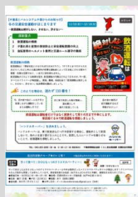
パルシステム千葉 機関誌パルノート