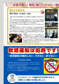
千葉県庁生協 生協だより