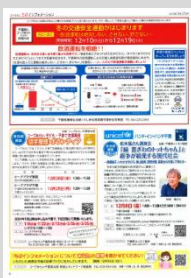
コープみらい機関紙 ちばインフォメーション