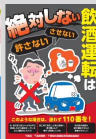
千葉県生協連 会報