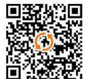
参加申込用 QR コード