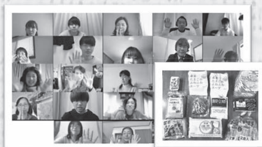
大学生と地域生協組合員の交流会