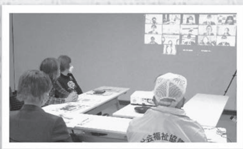
第6回地域・まちづくり委員会 千葉市社協地区部会委員と 組合員の交流会