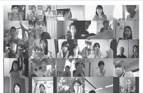
子どもたちに平和な未来を2020