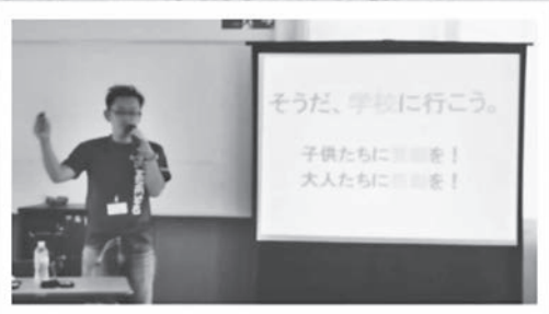
講演会「みんながハッピーな活動をめざして」