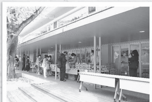
大学生への食料支援