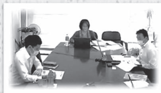
第1回食・消費者委員会 千葉県第3次消費者計画学習会