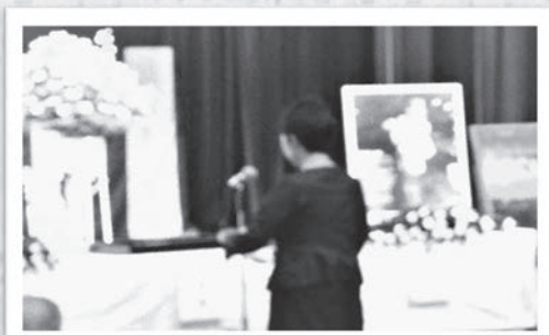
千葉県原爆死没者慰霊祭 平和の誓い