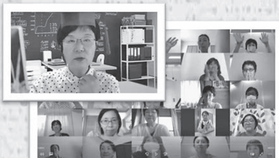
オンラインセミナー 「オンラインでできる楽しいコミュニケーション!! ～歌って・踊って・笑い飛ばす～」