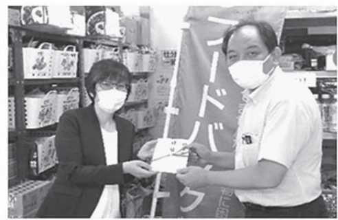
フードバンク支援金贈呈式

3. 自然災害への防災や減災対策、被災地支援を行政・諸団体と連携を強めすすめていきます。