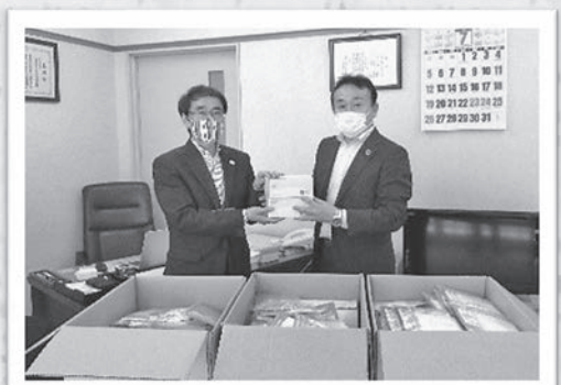
千葉市社会福祉協議会へ、会員生協から寄せられた未使用マスクの寄贈