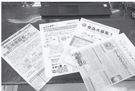
フードバンクちばと千葉県内生協との 連携キャンペーン