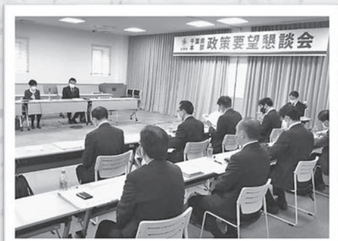
公明党千葉県議団との懇談