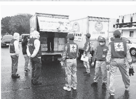
日本赤十字千葉県支部緊急物資搬送訓練