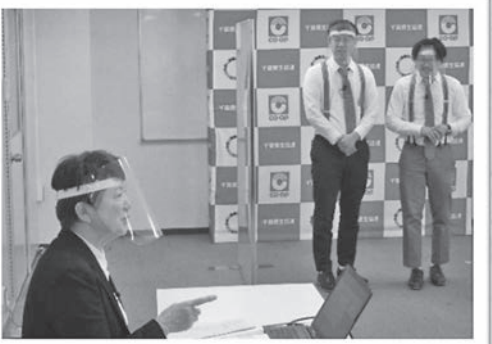
成年年齢引き下げ問題公開講座