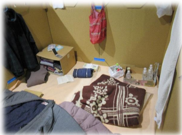
段ボールで仕切られた避難所

東京臨海広域防災公園は国の災害応急対策の拠点として整備された国営公園です。その中に防災体験学習施設「そなエリア東京」があります。今回は、首都直下地震の発生から72時間、どう生き残るのか、生き抜く知恵を学ぶ防災学習ツアーを体験しました。当日はエレベーターで下降中に地震が発生したという想定で、被災した街をタブレットでクイズに答えながら避難をするという体験でした。エレベーターから降りると停電した薄暗い従業員通路を避難誘導灯と非常放送に従い出口を目ざしました。途中で災害から身を守る方法などのクイズに答えながら余震の続く商店街や住宅地のジオラマの中を避難場所まで移動していきました。避難場所の展示品や防災グッズの展示コーナーでは見るだけでなく、ヘルメットの着用などの体験もしました。今回の体験学習では、災害をイメージする力と対応力を身につけることを学びました。