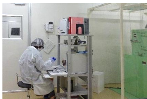
放射性物質検査室