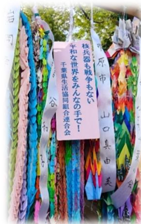
折鶴を献納しました