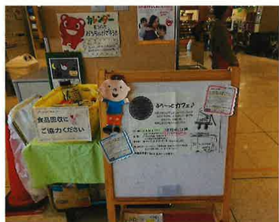
『ふら〜っとカフェ♪』のご案内