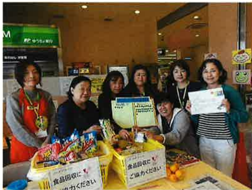
2区ブロックのみなさん