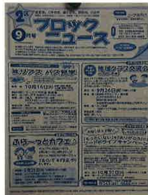
2区ブロックニュース