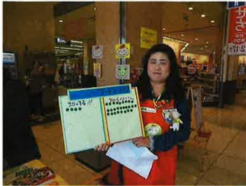
アンケート結果のボード