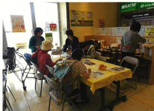
『ふら〜っとカフェ♪』の様子