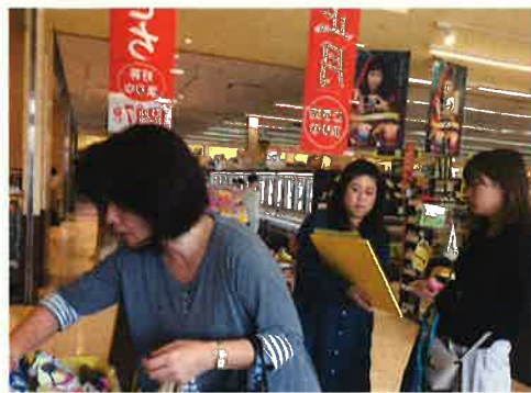
実際に聞いている様子

お買い物に来た方に声をかけて、フードライブの取り組みを知っているかを聞き、シールを貼ってもらっていました。ボードを見ながらシールを貼るので、一目で認知度が共有できる工夫がされていました。この時点では31人中、知っている人：4人、知らない人：27人で、知名度としては12.9%でした。今年は、昨年よりも知名度が上がっていると実感していました。