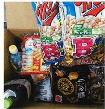
当日受け付けた食品

今回、2区ブロックでは、みんなで話し合っってキャンペーンをおこなう日時や場所を決めたそうです。当日は46人が『ふら〜っとカフェ♪』に参加し、たくさんの食品を提供してもらいました。食品を提供してくれた方の中には、ブロックニュース（写真中央）を見て親子で会場に来て食品を提供してくれた方もいらっしゃったそうです。クイズを活用してフードドライブの取り組みをたくさんの方に知らせるなど、様々な工夫がされていました。