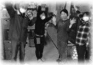
フードバンクちば