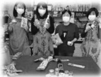
フードバンクふなばし