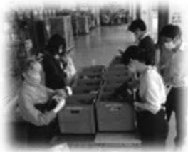
パルシステム千葉

各生協のフードドライブで集まった食品を使って、食品を寄贈してくれた多くの組合員と生活に困っている家庭や人々をつなぐ「つながりエール」を作りました。エールの作成については、参加の9団体がそれぞれ2～3文字程度を分担し順次キャンペーン専用Facebookに写真とコメントを掲載しました。全団体の文字が揃ったところで、食品で出来た文字をつなぎ合わせて1つのエールが完成しました。