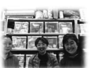
とうかつ草の根フードバンク