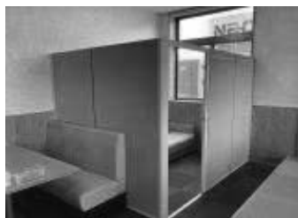
休憩室の中のベッドスペース