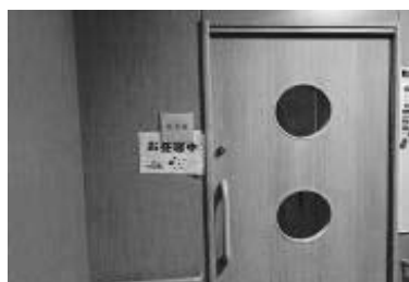
託児室 当日はお昼寝中でした