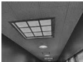
天井からのトップライト