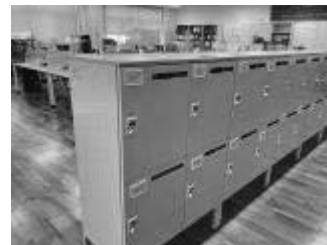
個人用のロッカー