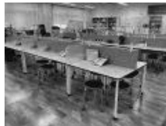
作業用のフリースペース