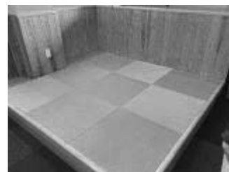
休憩室の畳スペース

駐車場にはEV充電スタンド、洗車時・災害時に活用する井戸水、屋根には太陽光パネルが設置されていました。