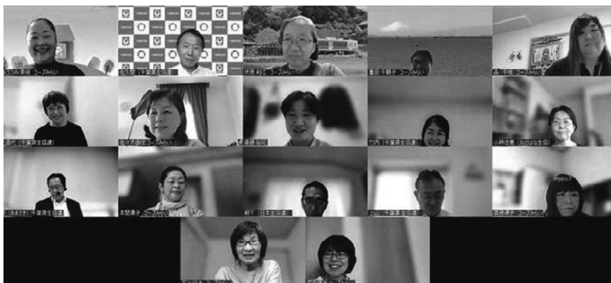
グループワークに参加されたみなさん

後半は4つのグループに分かれて、感じたこと、理解できたことまた保護者の立場など、自由に話し合いました。また事前にお寄せいただいた質問に講師にお答えいただきました。参加者からは社会に対する責任や、これからの若者たちとのかかわり方、また2035年の生協の在り方まで様々な意見がでました。