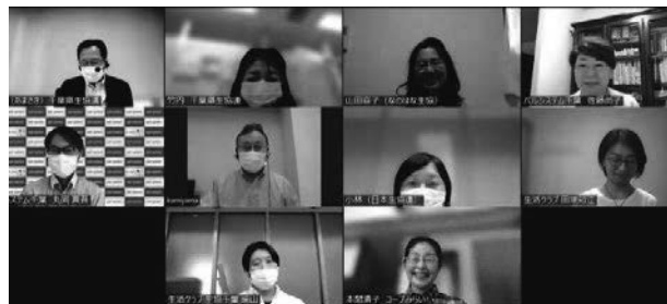
参加者のみなさん