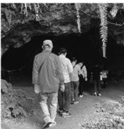
シムクガマ内部へ

最終日は、ホテル近くのチビチリガマ・シムクガマの2つの竈を見学しました。同じ読谷村内にある2つの竈ですが、チビチリガマは避難した住民の多くが捕虜になることが恥という教えにより自決などで命を落とし、一方シムクガマではハワイ帰りの住民が捕虜になっても生きることを説得し全員助かったという明暗が分かれた竈です。チビチリガマには未だ数多くの遺骨が残っており、遺族の意向により入壕することはできません。