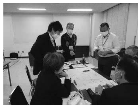
グループ討議の様子